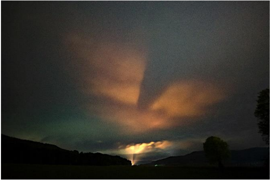
Eine schlecht ausgerichtet und unnötige Kirchenanstrahlung (Zella) erhellt den Nachthimmel weiträumig